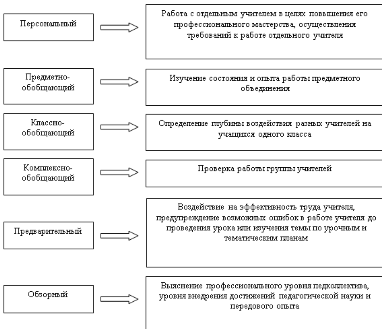
Рисунок 3. Формы внутришкольного контроля

С учетом того, что контроль осуществляется за деятельностью отдельного учителя, группы учителей, всего педагогического коллектива выделяются несколько форм контроля: персональный, классно-обобщающий, предметно-обобщающий, тематически-обобщающий, комплексно-обобщающий (Рис.3)